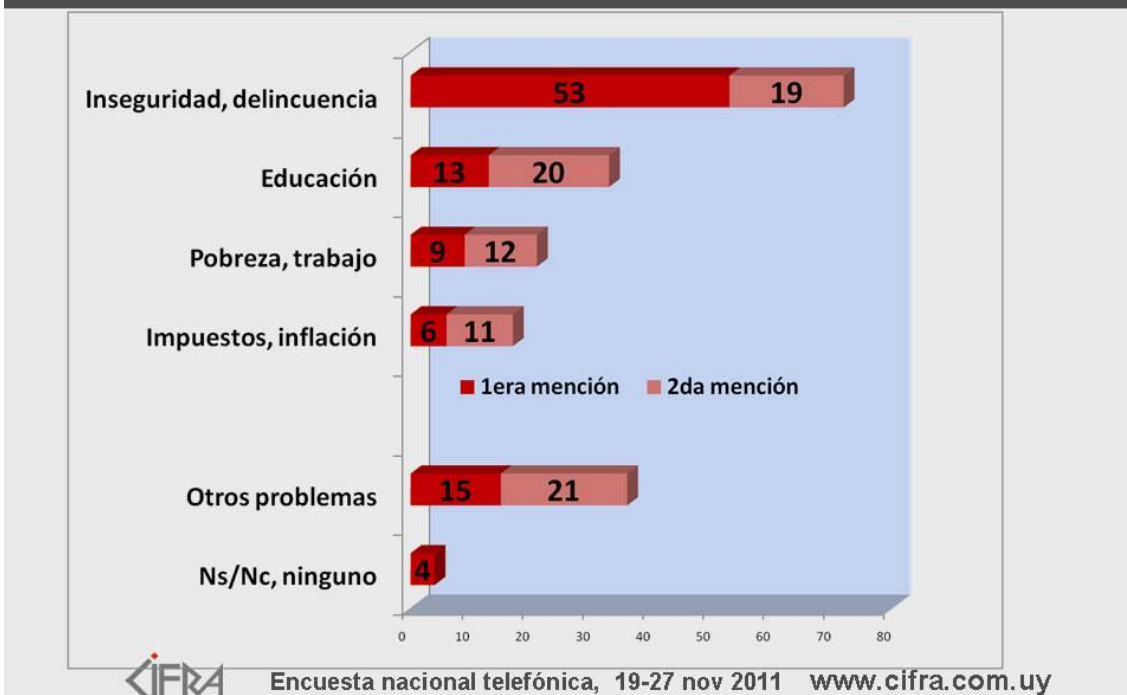
GRAFICO 2 - Encuesta de la consultora CIFRA sobre las principales preocupaciones de los uruguayos en 2011