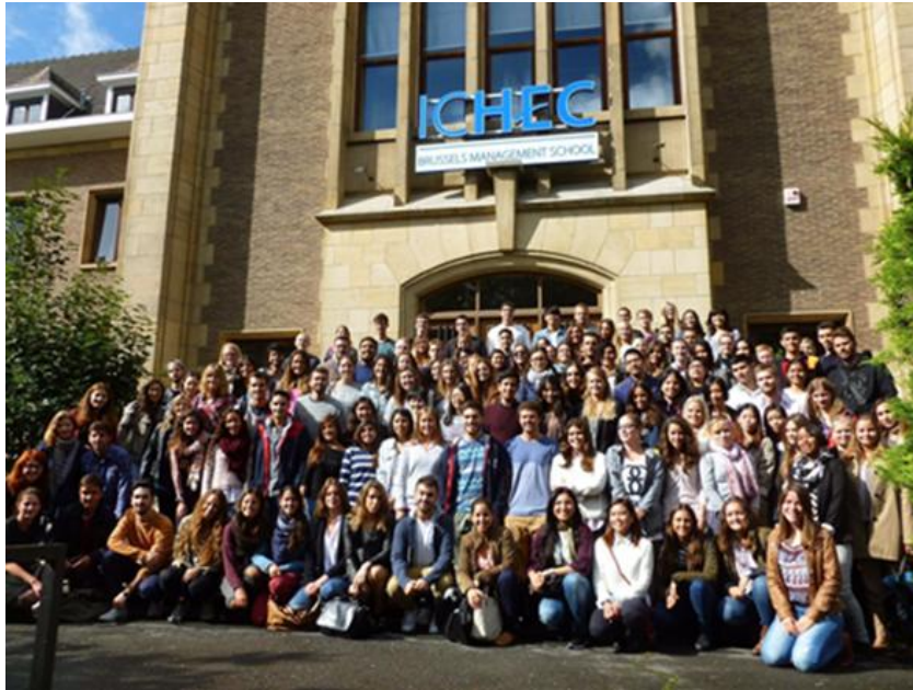
Foto representativa del intercambio en ICHEC