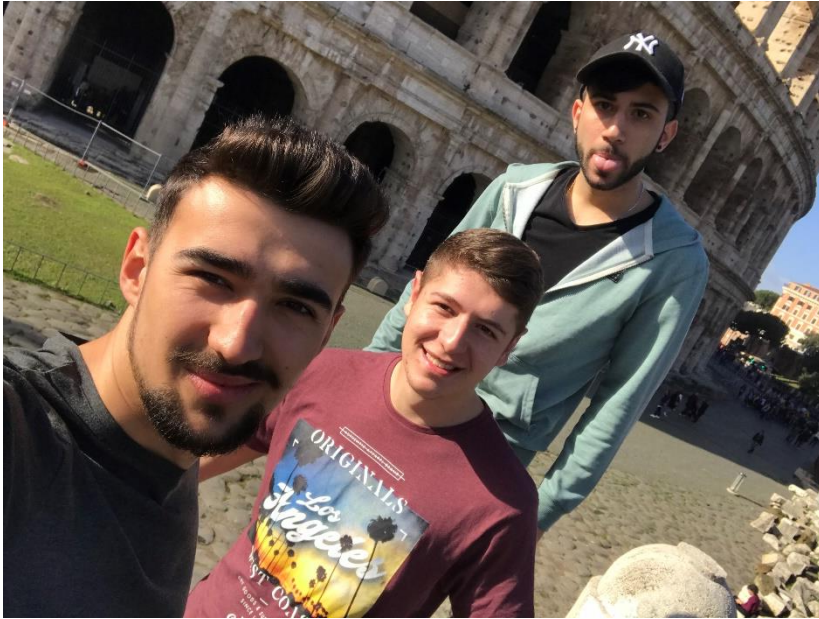
Viaje a Roma.