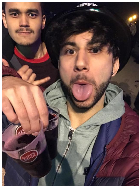
Fin de año en Lisboa