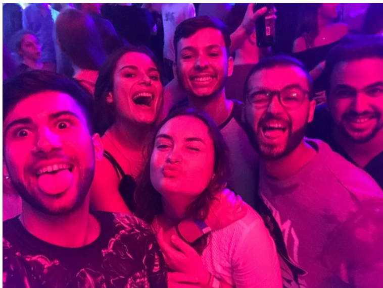
Fiesta de Bienvenida.

Estoy a disposición para cualquier consulta que me quieran hacer y por si necesitan alguna otra recomendación. No es posible describir todo en cinco páginas, pero les puedo ampliar. Mi mail es fabrnicolash@gmail.com pero también pueden escribirme a Facebook para comodidad de ambos. Espero tengan el mejor de los intercambios y disfruten el viaje tanto como yo, de verdad es una experiencia que recomiendo vivir.