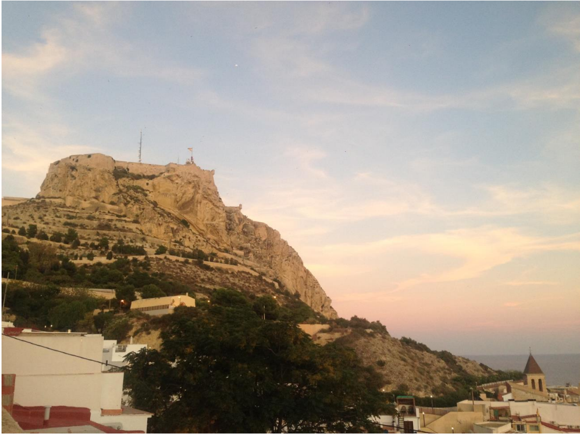
Castillo de Santa Barbara , Alicante