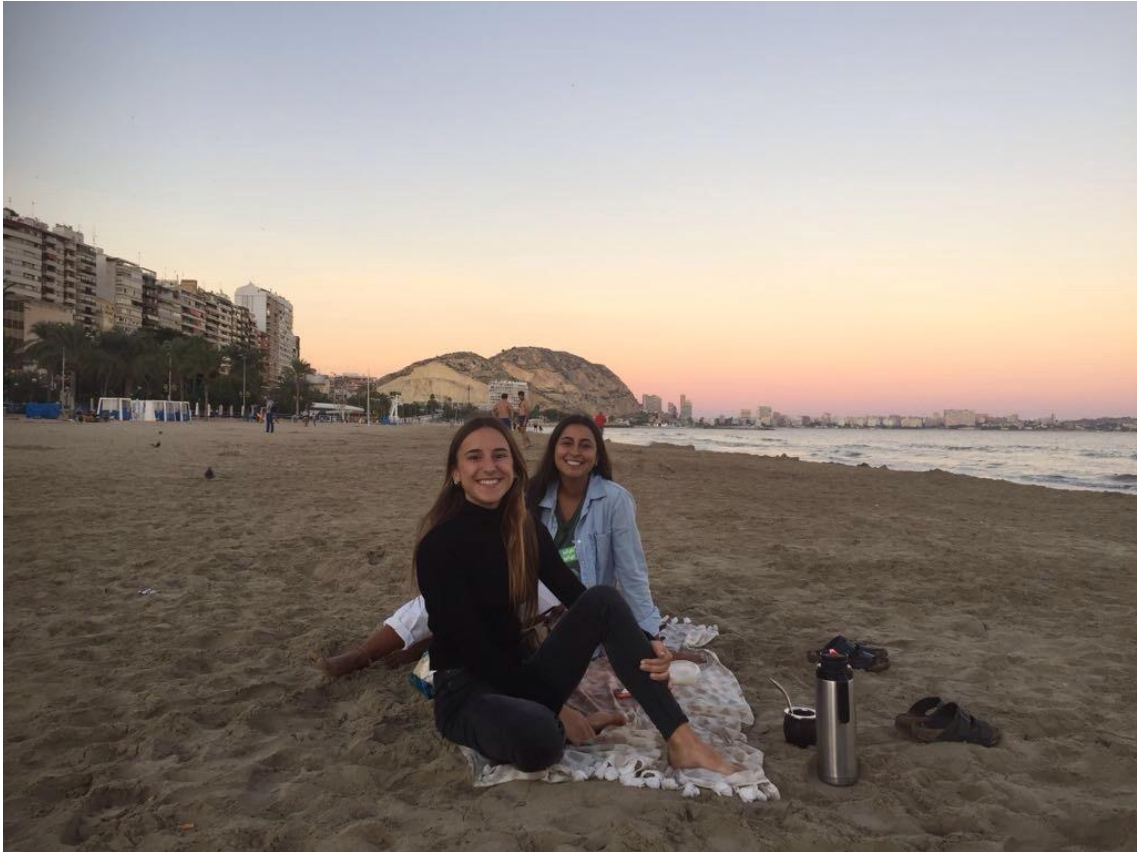
Atardecer en Playa Postiguat, Alicante