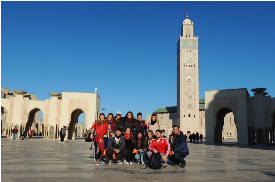
Viaje a Marruecos