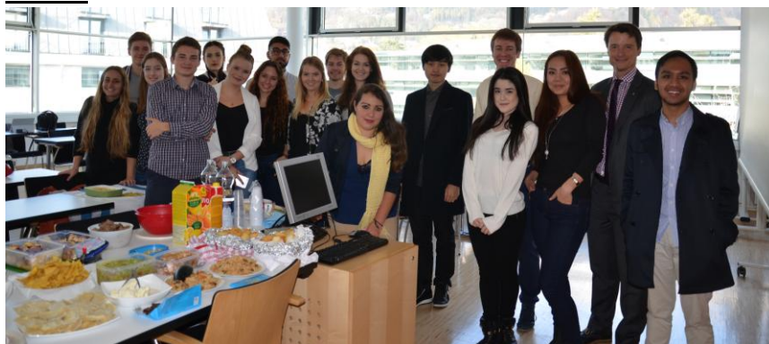
Feria Internacional de Comida - International Marketing