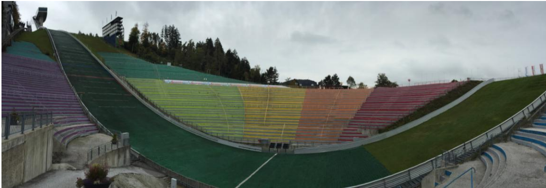
Bergisel - Salto de Skii