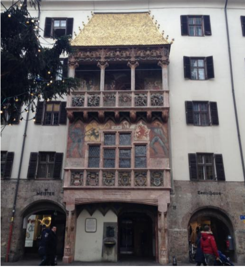
Tejadillo de Oro - Símbolo de Innsbruck