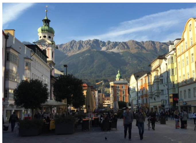
Maria-Theresien Strasse - Calle principal de Innsbruck