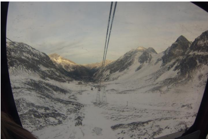
Vista desde funicular en Glaciar de Stubai